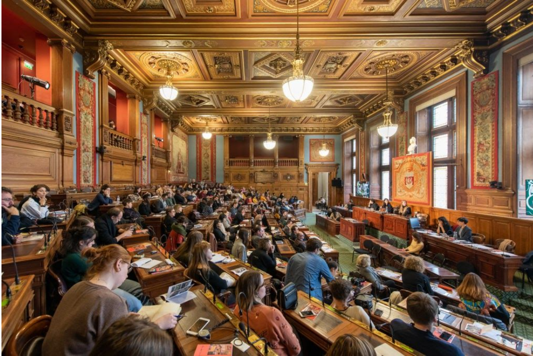
@ Temporary Parliament, Visible Award 2019 - Hôtel de Ville, Paris

Het Masterproject Kunst, Ontwerp en Beeld in een sociaal-politieke context nodigt je uit om kunst en ontwerp in de sociale en politieke sfeer te verkennen. Expliciet of niet, als beeldmaker is je persoonlijke of collectieve praktijk onlosmakelijk verbonden met de sociale en politieke context waarin deze zich situeert. Bovendien kun je met je sociaal geëngageerd werk ook tot denken aanzetten over deze contexten, ze inspireren of ze werkelijk transformeren. Door diepgaande coaching, zowel van interne als externe experts, ontwikkel je een intuïtie over wat het betekent om werk te creëren in relatie tot je maatschappelijke vraagstukken zoals bijvoorbeeld klimaatcrisis, solidariteitscrisis, alternatieve economieën, (de)kolonialisme, feminisme, commons, queer-cultures, om er maar een paar te noemen. Je ontwikkelt een persoonlijke of collectieve methode, aan de hand van een intensieve onderdompeling in relevante professionele contexten en door je verder te oriënteren op de historische praktijken van social design, sociaal geëngageerde kunst, community art, activisme, ecologische en dekoloniserende verbeeldingen, relational aesthetics, enzovoort (die verder bouwt op voorgangers zoals o.a. Situationisme, Tropicalia, Happenings, Fluxus en Dadaïsme). Samen met je medestudenten ga je een horizontale leeromgeving aan waarin je via het delen van empowerende instrumenten en gedachten